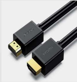
HDMI input Sync play