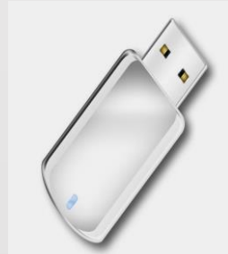
USB flash disk