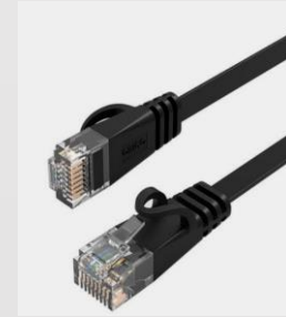
Reticle connect to play