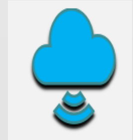
Cluster Cloud Play