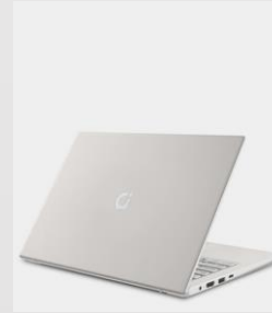
Software WIFI LAN