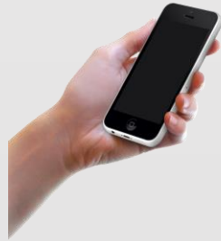
APP control to play